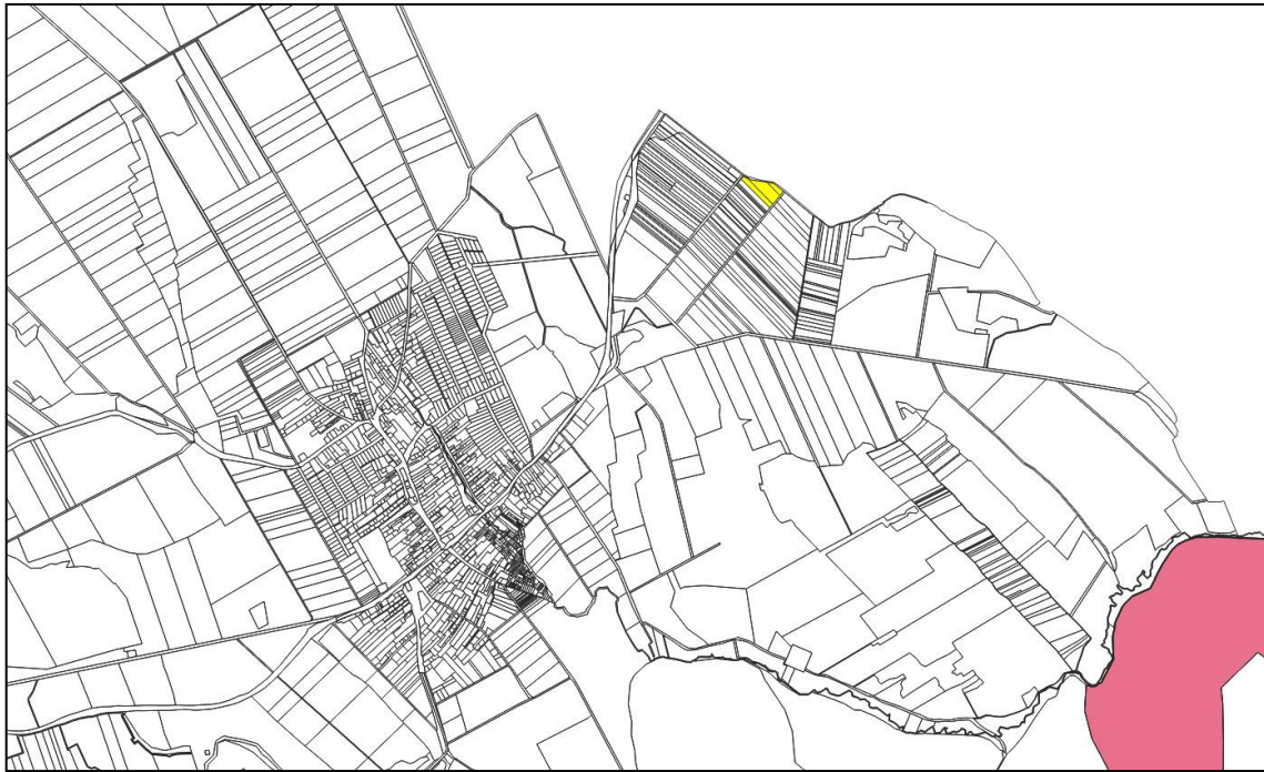
Natura 2000 területek övezete_ Forrás: e-tér adatszolgáltatás, szerkesztve (zöld vonallánc: kisajátítási terület határa)